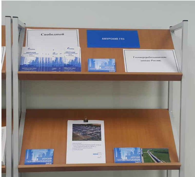
Рисунок 6.1 Информационный центр (читальный зал) Проекта

условий для консультации заинтересованных сторон. В Информационном центре установлен ящик для подачи жалоб и обращений (см. Раздел 7).