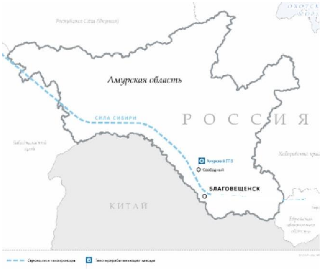
Рис. 1.1 Месторасположение Амурского ГПЗ 1

Амурский газоперерабатывающий завод (ГПЗ) будет построен в Дальневосточном федеральном округе РФ, в Свободненском районе Амурской области (Рис. 1.1). Это будет крупнейшее в России и одно из крупнейших газоперерабатывающих предприятий в мире. Проектная мощность предприятия составит до 42 млрд. куб. м в год.